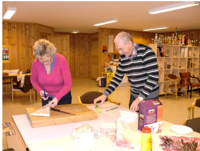
Bildet er hentet fra KIL sitt ukentlige veterantreff.

Inspirasjons- Motivasjons- Forebyggings- og Aktivitetsprosjekt for eldre med store hjelpebehov i Kvam